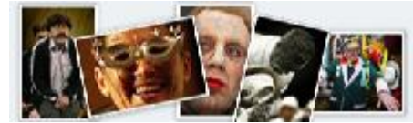
IMÁGENES DEL CARNAVAL 2004

Carnavaleando: Noticias, entrevistas y actualidad de los carnavales de toda Andalucía. Presenta un completo listado de enlaces a otras webs relacionadas con el carnaval así como de autores de las agrupaciones más célebres. La "agenda carnavalesca" irá registrando los acontecimientos más destacados durante la fiesta.