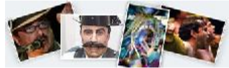
IMÁGENES DEL CARNAVAL 2003